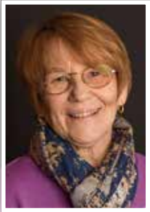
Tekst og foto: Anne Jordbruen