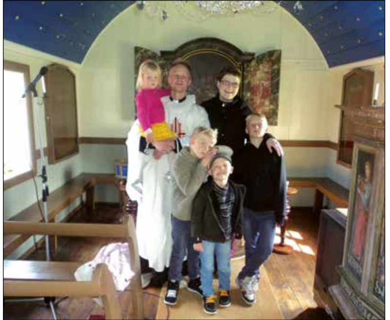
Familien i Knapptadakerke på Fljótin, Islands eldste trekirke, bygget i året 1834.

I år 2004, da jeg var 26 år gammel, ble jeg ordinert sokneprest i Hofsós- og Hólaprestegjeld i Nordvest-Island. Prestegjeldet omfatter for det meste et landbruksområde. Der finnes to tettbebyggelser, Hofsós og Hólar. Prestegjeldet er stort og varierende og omfatter seks soknekirker, deriblant domkirken på Hólar, en av de tre domkirkene i Island, og deles i tre oppdragsområder som er knyttet til respektive Hofsós, Hólar og Fljót og bygdene de i mellom. Gjennom den tiden