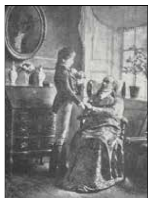
Måleri av Carl Thomsen: Den unge Adam Oehlenschläger er innom den sjuke diktaren Edvard Storm. Frå boka "Edvard Storm Døla-viser" utgjeve av Dølaringen Boklag.

«Markje grønast, sjogen bråna», og «Oss ha gjort kå gjærast skulle», er kanskje mest kjent av det prestesonen frå Vågå, Edvard Storm (1749 – 1794) dikta saman med «Herr Sinclair drog over saltan Hav». Ikkje visste eg at han au var salmediktar før eg las Årbok for Gudbrandsdalen 1946. Der har ein som kallar seg berre «På norsk ved H.», omsett tre salmar etter Døladiktaren til nynorsk. Salmane er berre stutte, frå tre til fem vers og er skrivne til kjende salmetonar.