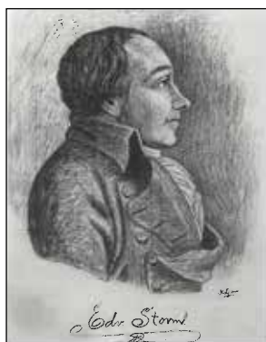
Edvard Storm teikna av Knut Ljøsne. Foto: Per Olav Eide 1994. Frå boka "Edvard Storm Døla-viser" utgjeve av Dølaringen Boklag.