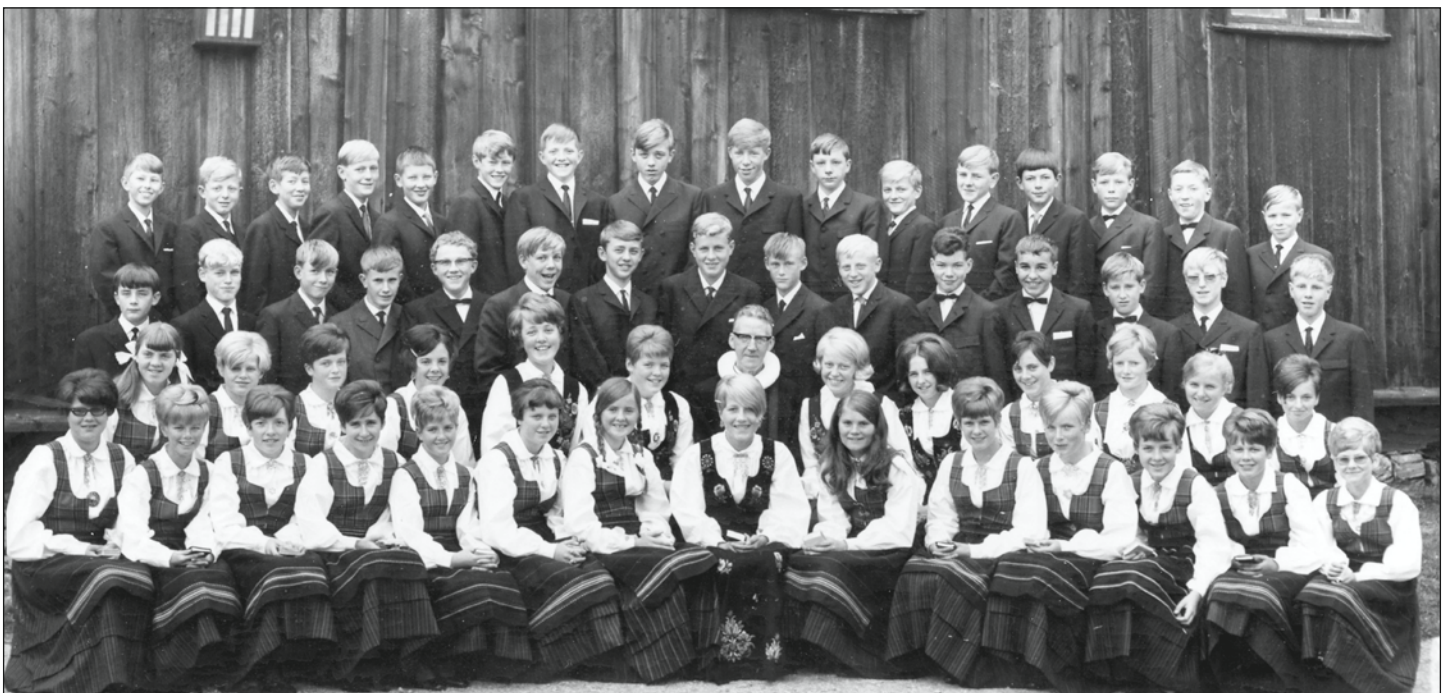
Konfirmanterne 1968, Ringebu Stavkyrkje.