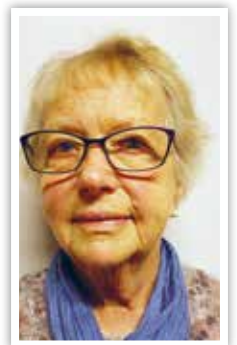
Tekst og foto: Liv Jorunn Braastad