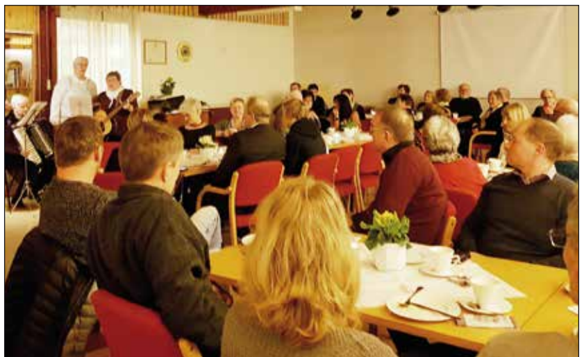
Noen av de framømte.