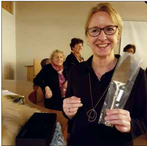
Det vanket gaver.