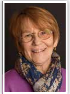
Tekst og foto: Anne Jordbruen