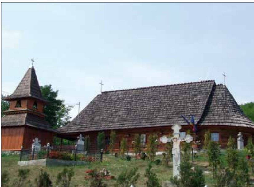
Kirka av Sankt Mikkel og Gabriel.

Og et stort VELKOMMEN til Norge og Ringeby til en varm og klok kvinne!