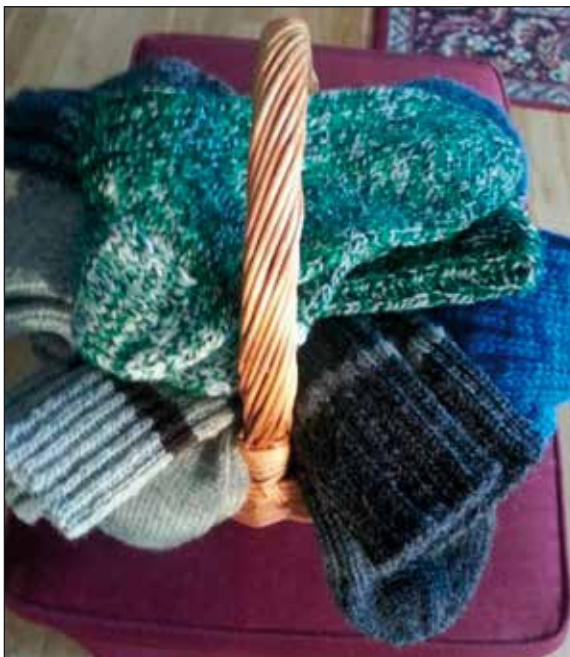
Korga full av ullsokker.

"Det ligger mye varme og omtanke i hver eneste maske".