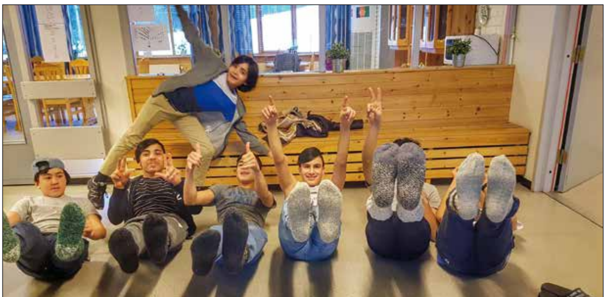
Glade unger med varme labber.