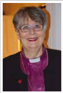
Solveig Fiske Hamar biskop