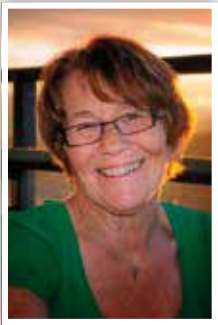
Tekst og foto: Anne Jordbru