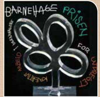
Barnehagene og Kulturskolen

tilhold på Selje, er en kraftfull kunstner med markante, fargesterke bilder, som det vil være en fryd å se i Prestegarden.