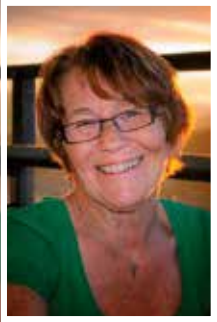
Tekst og foto: Anne Jordbruen