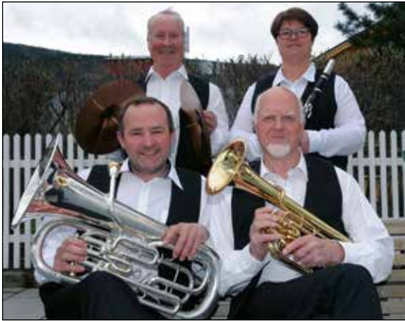
Styret i Ringebu Musikkforening.