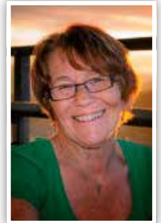
Tekst og foto: Anne Jordbruen

Vel, dette var en tanke jeg gjorde meg 8. mai, under markeringen.