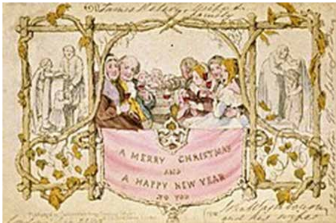
Det første julekortet trykt i England i 1843

I Tyskland vart det laga kort med religiøse motiv alt på 1400-talet, kort som skulle sikre mottakaren høgtid og lykke. Men det kortet som blir rekna for å vere det første, verkelege, julekortet, kom ut i England i 1843. Embetsmannen Henry Cole hadde ideen til dette kortet. Han fekk målarer John C. Horsley til å lage eit tredelt motiv. I midten er ein familie, tre generasjonar, som alle hever vinglas.