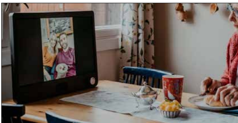
Foto kopiert fra: https://www.noisolation.com/no/komp Les gjerne mer der.

En sønn sier: «Det er en praktisk måte å holde kontakt med hverandre på. Brukervennligheten til KOMP er suveren, sammenlignet med smarttelefon og nettbrett.