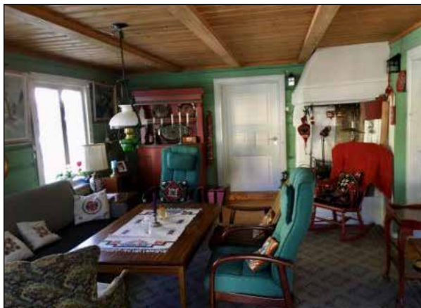
Dagligstua i første etasje.